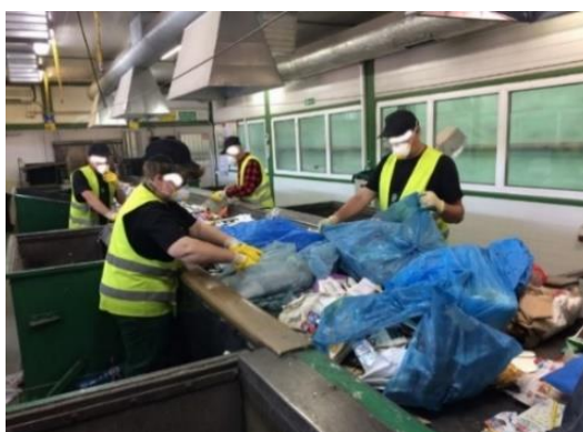
Fot. 2 Linia sortownicza doczyszczania selektywnej zbiórki odpadów