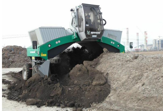
Fot. 3 Kompostownia